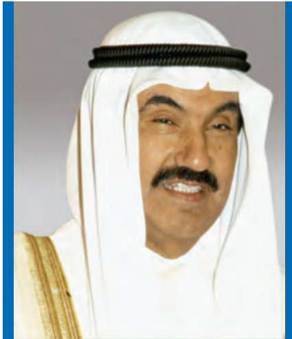
الشيخ / ناصر المحمد الأحمد الصباح حفظ الله ورعاه سمو رئيس مجلس الوزراء