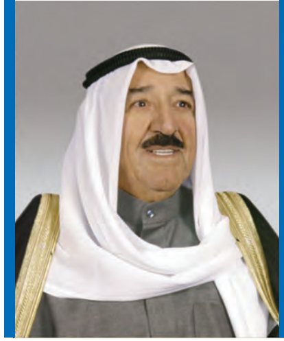
الشيخ / صباح الأحمد الجابر الصباح حفظ الله ورعاه صاحب السمو أمير البلاد