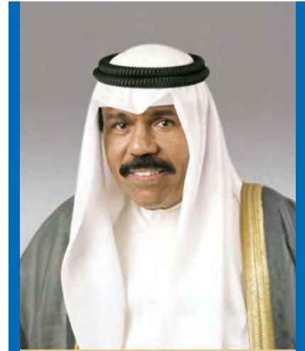
الشيخ / نواف الأحمد الجابر الصباح حفظ الله ورعاه سمو ولي العهد