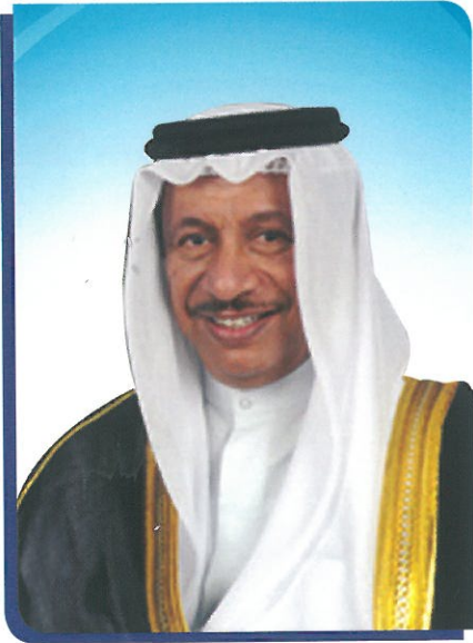
الشيخ / جابر مبارك الحمد الصباح حفظه الله ورعاه رئيس مجلس الوزراء