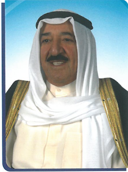
الشيخ / صباح الأحمد الجابر الصباح حفظه الله ورعاه صاحب السمو أمير البلاد